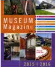
Cover van het Museum Magazine 2015-2016.