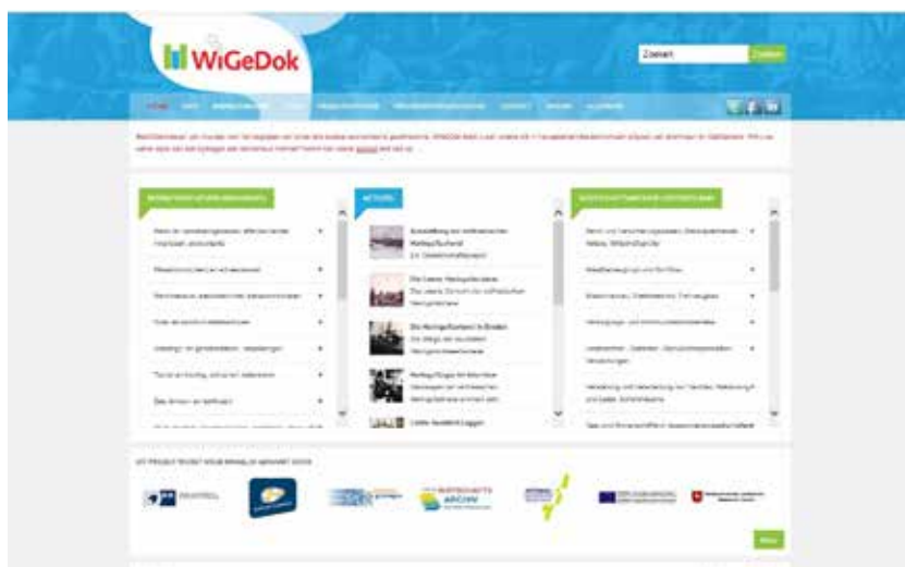
Screenprint van de Wigidok-website.

(WiGeDok). In dit project hebben de Groninger Archieven nauw samengewerkt met het Staatsarchief Aurich en de Kamer van Koophandel voor Ostfriesland-Papenburg te Emden. In WiGeDok zijn talloze bedrijfsarchieven uit Ostfriesland en Groningen geïnventariseerd en toegankelijk gemaakt via de website wigidok.eu . Het ontsluiten en toegankelijk maken via dit grensoverschrijdende portal geeft volgens de initiatiefnemers een impuls aan het 'bedrijfshistorische erfgoed' en vergemakkelijkt vergelijkend historisch onderzoek.