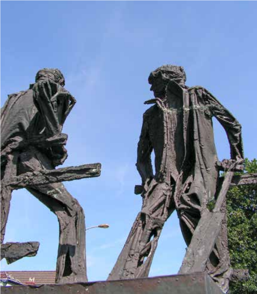
Veengravers, beeld in Sappemeer. Maker: Hans Mes.

torische structuren. Dat biedt kansen in twee richtingen. Ten eerste zouden Noord-Nederlandse auteurs vaker kunnen publiceren in Noordwest-Duitse jaarboeken (en vice versa). Dit is al vaker gebeurd: meerdere auteurs hebben de grensoverschrijdende weg naar nieuwe publicatiemediën weten te vinden. 15 Ten tweede zouden redacties van jaarboeken kunnen samenwerken. Ook deze vorm van toenadering kent precedents. In 2012 hebben het Historisch Jaarboek Groningen en het Emder Jahrbuch een zogenaamde ‘Doppelpublikation’ geïntroduceerd. Daartoe is allereerst een thema geselecteerd. In dit voorbeeld werd gekozen voor de toenadering tussen leraren en scholieren in Groningen en Ostfriesland, direct na de Tweede Wereldoorlog. Vervolgens is een Duitse en een Nederlandse auteur benaderd. Beide auteurs hebben, elk vanuit hun eigen perspectief, het proces van toenadering beschreven en geanalyseerd. Dit heeft twee originele bijdragen opgeleverd die zowel in het Nederlands als in het Duits beschikbaar zijn. 16