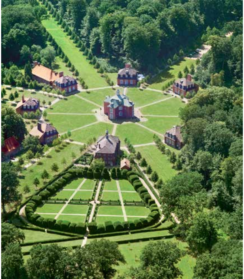
Een luchtfoto van Schloss Clemenswerth bij Sögel, waarin het Emslandmuseum is gevestigd.

blikte op dit proces terug. 9 Volgens hem vertegenwoordigden de Nederlanders en Duitsers elk een eigen traditie, die zij niet van elkaar kenden. Niettemin was er sympathie voor elkaars werkwijze en vormden de leerervaringen een goede basis voor verdere samenwerking.