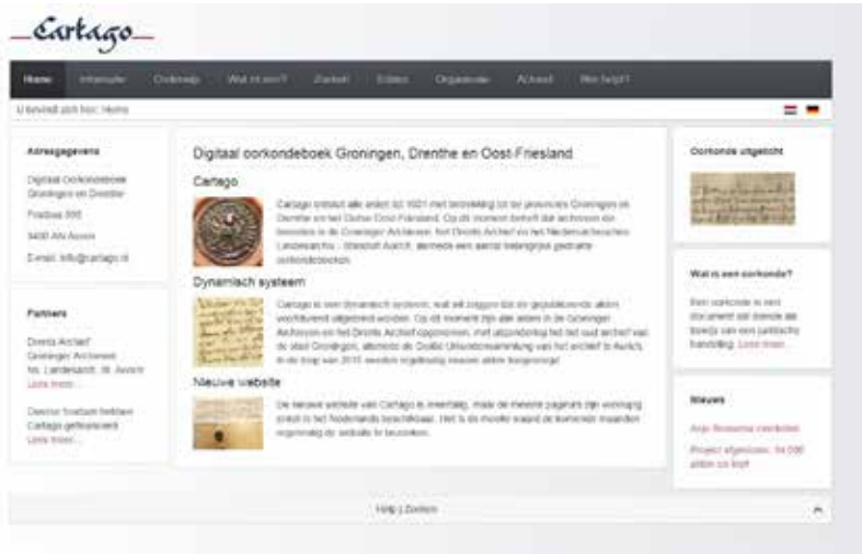
Screenprint van de Carthago-website.

Maar na veel pieken kunnen we ook een terugval ontwaren, een dal waarin de echo van het succes nog naklinkt. Na een opzienbarend project blijft een vervolgproject vaak uit. Toch kan juist een vervolg de nodige verdieping aanbrenge. Neem de mijlpaal Rondom Eems en Dollard . Hoewel de bundel talloze onderwerpen voor nader onderzoek heeft genoemd, bleef een nieuwe bundel met dezelfde statuur tot op heden uit. De energie en inspiratie, opgewekt door de auteurs, is weggeëbd of heeft in elk geval niet een duidelijk vervolg gekregen. Je hoeft niet voortdurend mijlpalen met elkaar te produceren maar een basisniveau van samenwerking is goed voor de continuïteit in gezamenlijke, historische producties. In die zin is het incidentele karakter een probleem. Dat valt niemand persoonlijk aan te rekenen: het betreft hier geen probleem dat op individuen is te herleiden. Het is een collectief probleem.